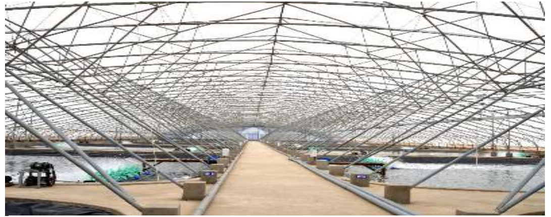
“Resort” cho tôm thuộc Tập đoàn Việt Úc tại Bạc Liêu tại P. Nhà Mát, Tp. Bạc Liêu, tỉnh Bạc Liêu

Các ao nuôi có trang bị thiết bị thu sóng siêu âm Sonar, quạt nước, máy bơm oxy... hoạt động liên tục 24/24 giờ nhằm đảm bảo các điều kiện cần thiết cho tôm phát triển. Nhiệt độ ao được giữ ở mức ổn định dưới 31°C và chỉ dao động trong khoảng 1,5°C từ ngày sang đêm... Vì thế công nghệ này được xem là mô hình nuôi thâm thiện với môi trường, cho năng suất nuôi cao và có thể áp dụng ở nhiều nơi khác nhau.