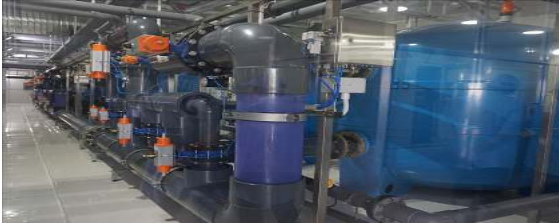
Nhà máy xử lý nước công nghệ cao áp dụng cho sản xuất tôm giống lớn nhất Việt Nam tại Việt Úc Bạc Liêu.