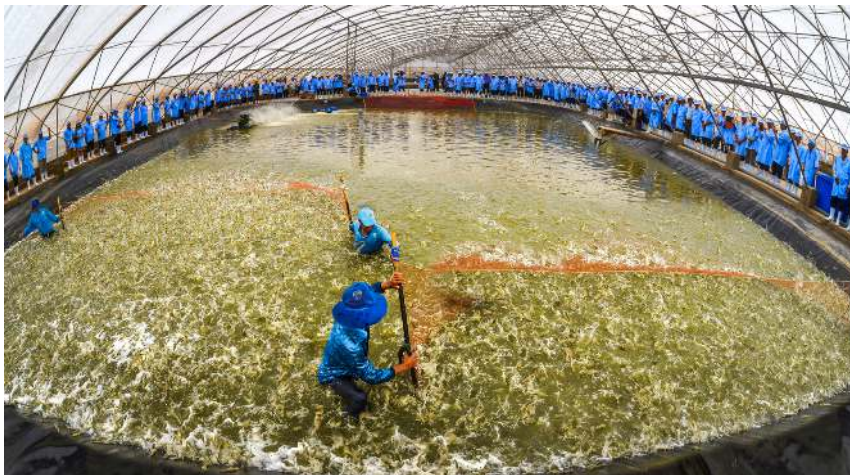
Lễ thu hoạch tôm Mô hình nuôi tôm công nghệ cao trong nhà kính