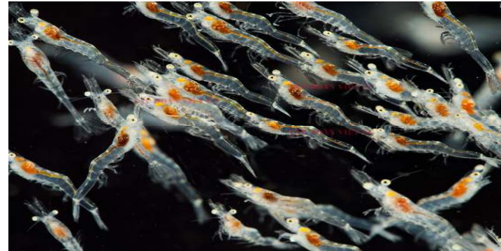
Tôm giống công nghệ cao