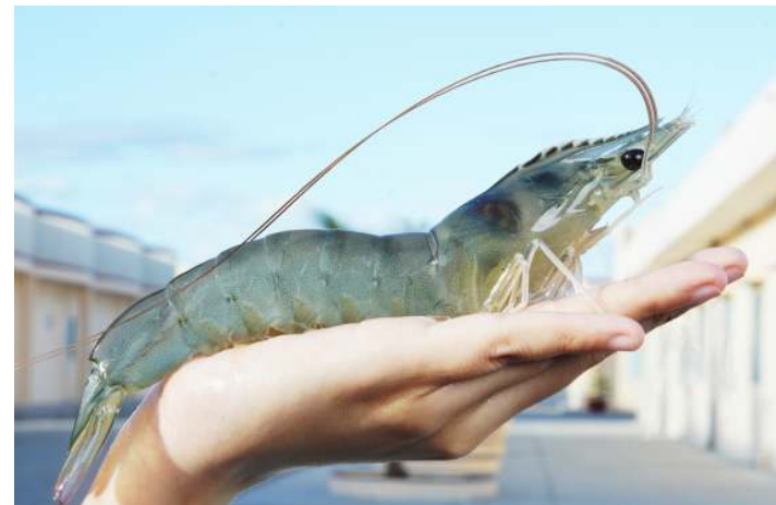
Việt Úc có chương trình Di truyền & Chọn giống Tôm Bố Mẹ đầu tiên & duy nhất tại Việt Nam