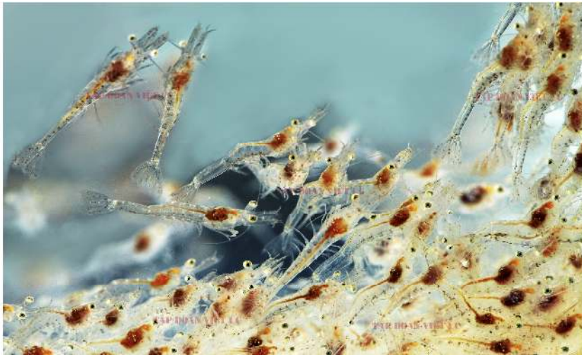
Tôm giống Công Nghệ Cao chuyên độ mặn cực thấp

Toàn bộ các cơ sở sản xuất của Tập đoàn Việt Úc đều bố trí mặt bằng đồng bộ về các thiết bị phục vụ sản xuất trong nhà. Việc thiết lập các cơ sở sản xuất ở nhiều địa điểm khác nhau giúp giảm thiểu tác động của rủi ro. Các khu vực sản xuất nằm ở khu vực tách biệt ở mỗi tỉnh với hệ thống lọc nước riêng biệt, khu nhà trại giống độc lập, ao nuôi tách biệt trong mỗi nhà trại giúp bảo đảm và tăng cường an toàn sinh học. Việc bố trí cơ sở sản xuất một cách độc lập tạo điều kiện thuận tiện cho việc bảo trì ao nuôi khi cần thiết. Chế độ an toàn sinh học là yếu tố then chốt giúp Công ty duy trì tiêu chuẩn không kháng sinh.