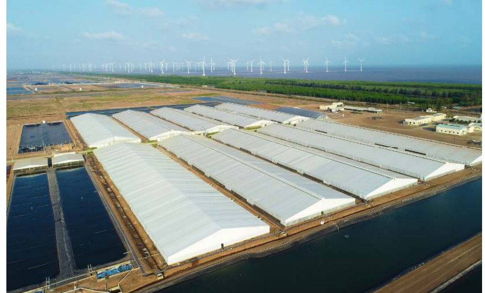
Khu Phức Hợp Nuôi & Sản Xuất Tôm Thương Phẩm Công Nghệ Cao VIỆT ÚC NHÀ MÁT