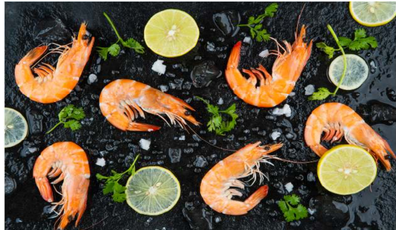
Con Tôm Hoàn Hảo của Tập đoàn Việt Úc