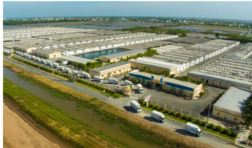
Khu phức hợp Sản xuất Tôm giống Công Nghệ Cao