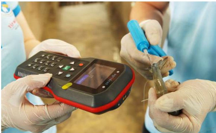
Công nghệ cấy Chip vào Tôm Bố Mẹ

Về mặt hình ảnh, điều này giúp làm thay đổi thứ hạng của ngành tôm nước nhà trên bản đồ thế giới.