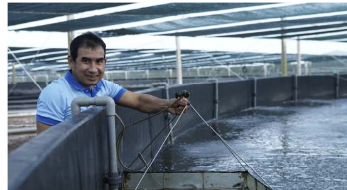
“Resort” cho tôm thuộc Tập đoàn Việt Úc tại Bạc Liêu