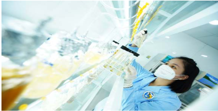
Công nghệ Tảo

Việt Úc là Tập đoàn duy nhất có tới 9 Khu Phức Hợp sản xuất tôm giống đã chính thức được trao Chứng Nhận Khu NNUDCNC. Ngoài ra, Khu Phức Hợp sản xuất Tôm giống Công Nghệ cao Việt Úc Bạc Liêu còn nhận Giấy chứng nhận là cơ sở sản xuất đạt chuẩn an toàn dịch bệnh theo khuyến cáo của Tổ chức Thú y thế giới (OIE) vào năm 2018.