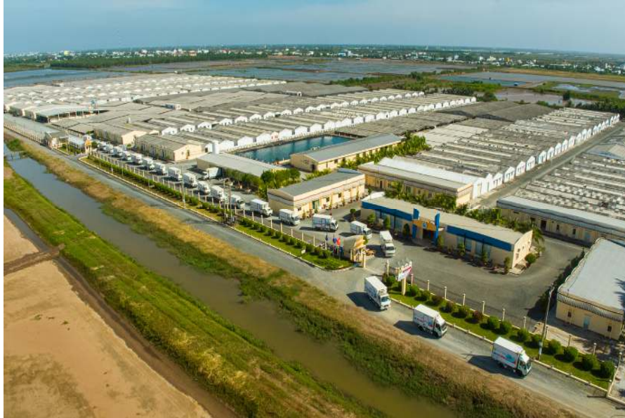
Khu Phức Hợp Sản Xuất Tôm giống Công Nghệ Cao VIỆT ÚC BẠC LIÊU