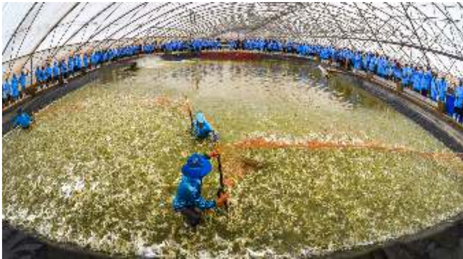
Lễ thu hoạch tôm Mô hình nuôi tôm công nghệ cao trong nhà kính