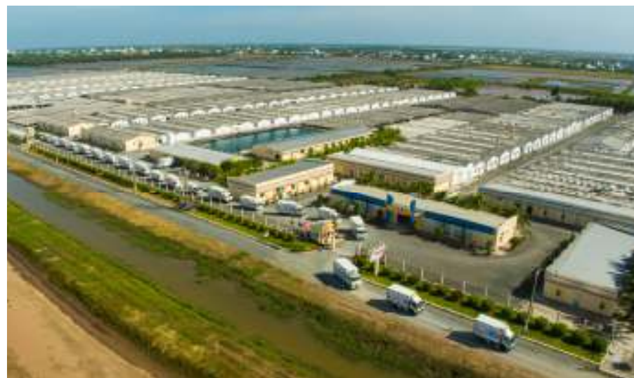
Khu phức hợp Sản xuất Tôm giống Công Nghệ Cao