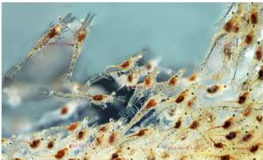
Tôm giống Công Nghệ Cao chuyên độ mặn cực thấp

Toàn bộ các cơ sở sản xuất của Tập đoàn Việt Úc đều bố trí mặt bằng đồng bộ về các thiết bị phục vụ sản xuất trong nhà. Việc thiết lập các cơ sở sản xuất ở nhiều địa điểm khác nhau giúp giảm thiểu tác động của rủi ro. Các khu vực sản xuất nằm ở khu vực tách biệt ở mỗi tỉnh với hệ thống lọc nước riêng biệt, khu nhà trại giống độc lập, ao nuôi tách biệt trong mỗi nhà trại giúp bảo đảm và tăng cường an toàn sinh học. Việc bố trí cơ sở sản xuất một cách độc lập tạo điều kiện thuận tiện cho việc bảo trì ao nuôi khi cần thiết. Chế độ an toàn sinh học là yếu tố then chốt giúp Công ty duy trì tiêu chuẩn không kháng sinh.