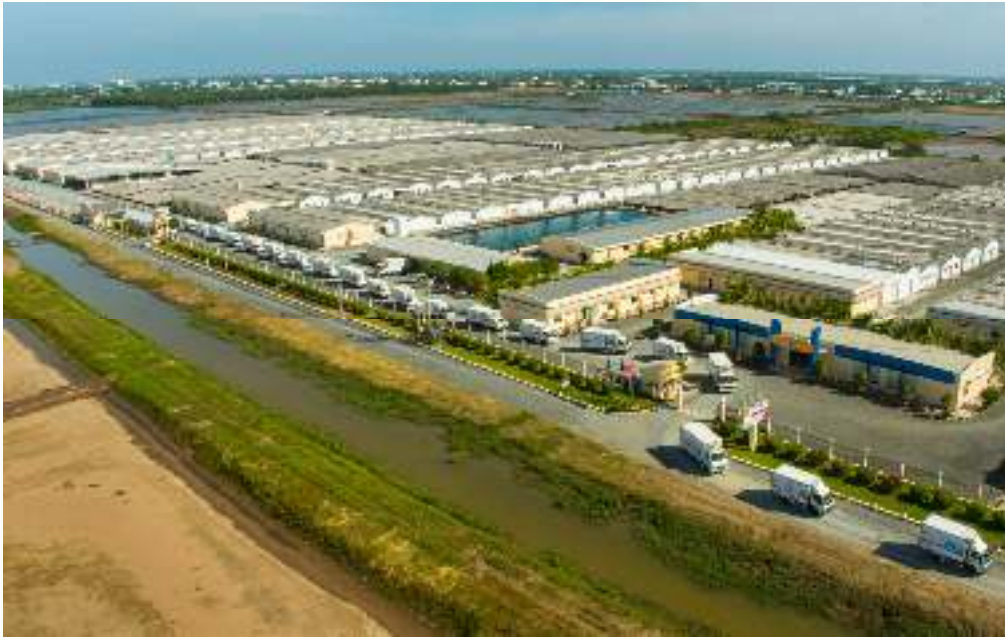
Khu Phức Hợp Sản Xuất Tôm giống Công Nghệ Cao VIỆT ÚC BẠC LIÊU