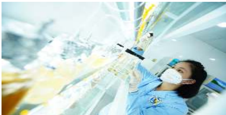
Công nghệ Tảo

Việt Úc là Tập đoàn duy nhất có tới 9 Khu Phục Hợp sản xuất tôm giống đã chính thức được trao Chứng Nhận Khu NNUDCNC. Ngoài ra, Khu Phục Hợp sản xuất Tôm giống Công Nghệ cao Việt Úc Bạc Liêu còn nhận Giấy chứng nhận là cơ sở sản xuất đạt chuẩn an toàn dịch bệnh theo khuyến cáo của Tổ chức Thú y thế giới (OIE) vào năm 2018.