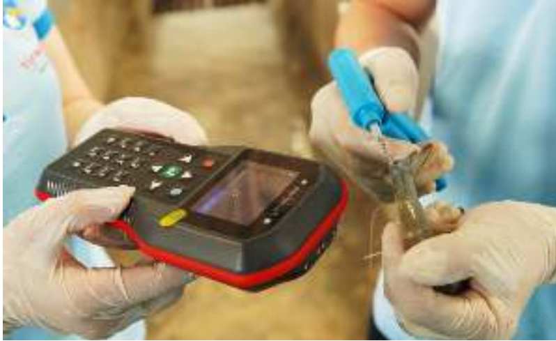
Công nghệ cấy Chip vào Tôm Bó Mẹ