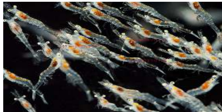
Tôm giống Công nghệ Cao VUS LEADER 21