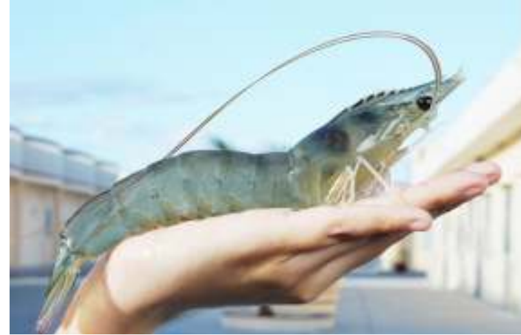
Việt Úc có chương trình Di truyền & Chọn giống Tôm Bó Mẹ đầu tiên & duy nhất tại Việt Nam