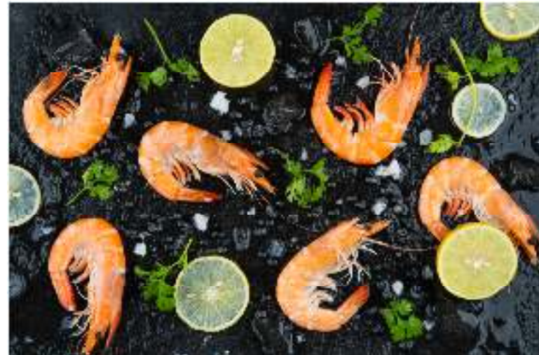
Con Tôm Hoàn Hảo của Tập đoàn Việt Úc