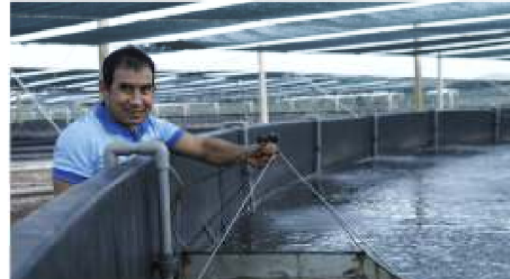
“Resort” cho tôm thuộc Tập đoàn Việt Úc tại Bạc Liêu