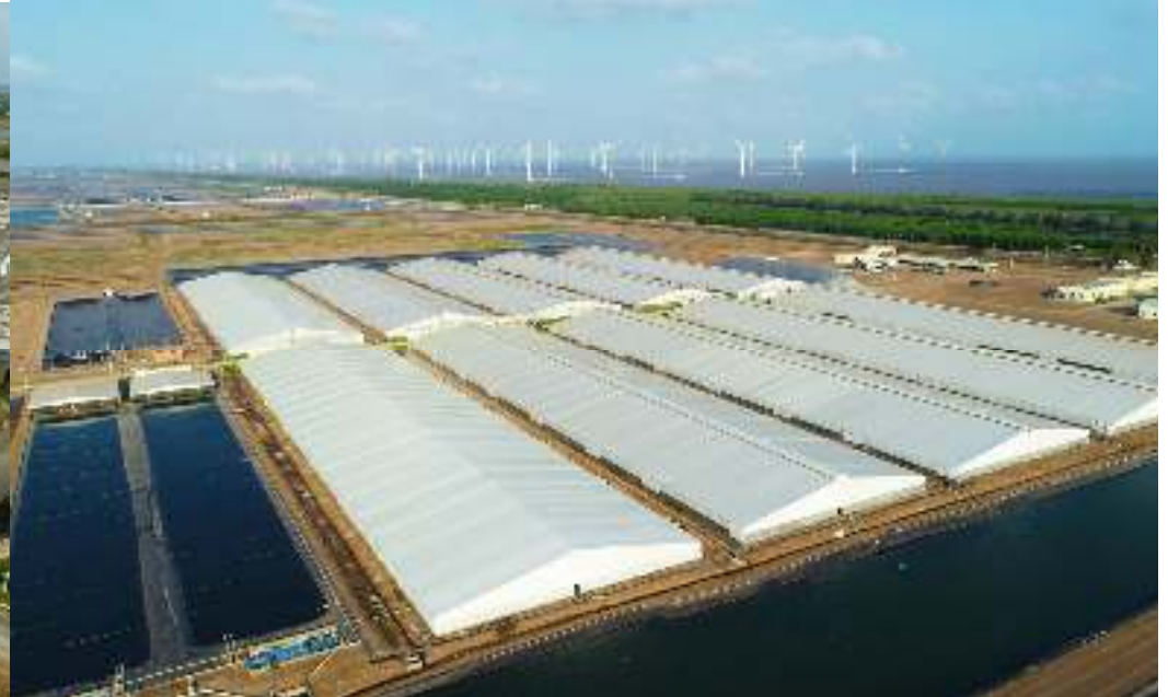
Khu Phức Hợp Nuôi & Sản Xuất Tôm Thương Phẩm Công Nghệ Cao VIỆT ÚC NHÀ MÁT